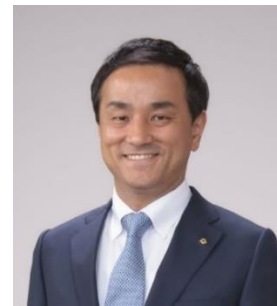
山口県知事 村岡嗣政

こうした時代を切り拓いていく若者に必要な力とは何か、そして、そのためには何が必要かについて、村岡嗣政山口県知事と全国で活躍する有識者が語り合います。