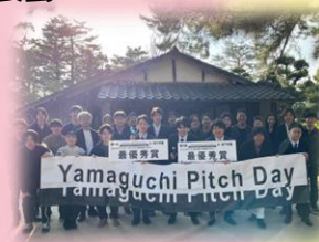
松下村塾での最終成果発表会（R4年度）