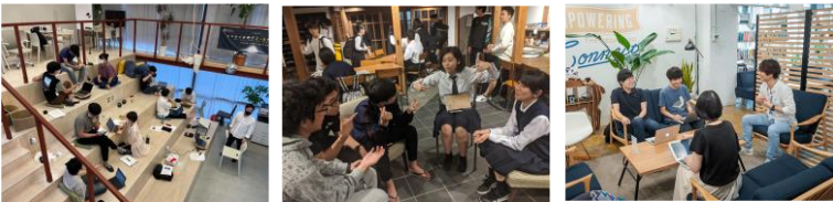
ガイアックスの「起業ゼミ」の様子