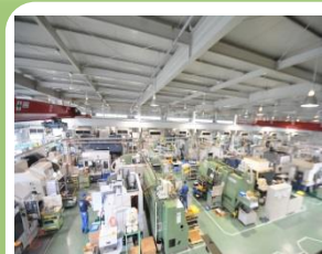
(株)ひびき精機本社工場 (山口県下関市)

第4回山口県産業技術振興奨励賞山口県知事賞受賞。第51回「グッドカンパニー大賞」受賞。経済産業省「地域未来牽引企業」に選定。