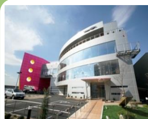
HILLTOP(株)本社 (京都府宇治市)

2002年度、2006年度「関西IT百選」最優秀企業。2008年度「京都中小企業優良企業表彰」。経済産業省「地域未来牽引企業」に選定。