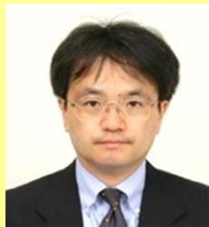
文部科学省 総合教育政策局 社会教育振興総括官 (兼)政策課長 寺門 成真氏

茨城県生まれ。1991年4月、文部省入省。文化庁、初等中等教育局、高等教育局、石川県等の勤務を経て、2008年9月、教育政策全般のとりまとめである文部科学省生涯学習政策局政策課教育政策推進室長に就任。復興庁総括官付参事官、高等教育局医学教育課長、内閣官房人生100年時代構想推進室参事官等を経て、2018年4月、生涯学習政策局政策課長に就任。2019年7月より現職。